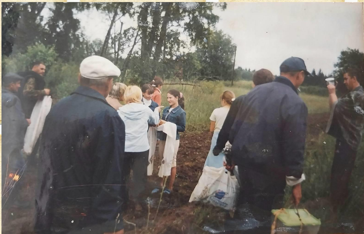
Фото 2. Праздник «Сабантуй»