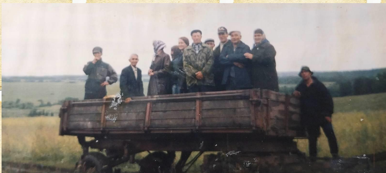
Фото 1. Фото сделано между деревнями Мата и Явъязы (путь держат к д.Явъязы)

Информация и фотоматериалы были взяты с записей Р.Зарипова (д.Мата).