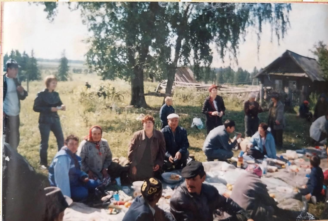
Фото 3. Встреча односельчан